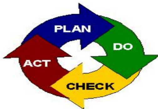
วงจรรวบรวมแผน P-D-C-A

องค์การบริหารส่วนตำบลไร่โคกได้ดำเนินการจัดทำแผนพัฒนาตำบลสามปี โดยยึดตามระเบียบกระทรวงมหาดไทยว่าด้วยการจัดทำแผนพัฒนาขององค์กรปกครองส่วนท้องถิ่น พ.ศ.๒๕๔๘ จัดให้มีกระบวนการมีส่วนร่วมจากภาคประชาชน ประชาคมท้องถิ่น สร้างความโปร่งใสตามพระราชบัญญัติว่าด้วยหลักเกณฑ์และวิธีการบริหารกิจการบ้านเมืองที่ดี พ.ศ.๒๕๔๖ และนำกระบวนการ PDCA มาใช้ประกอบการจัดทำแผนพัฒนาตำบลสามปี