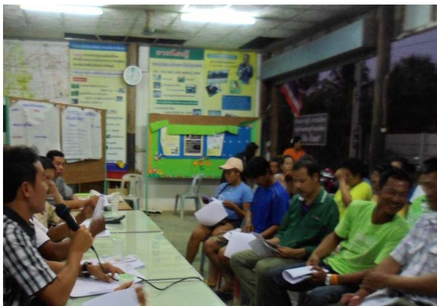
ประชุมทำแผนครั้งที่ ๔ ๔. ทำประชาวิจารณ์และจัดทำแผนฉบับสมบูรณ์