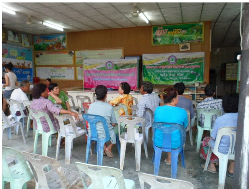
ประชุมทำแผนครั้งที่ ๒

๑. ประชุมชี้แจงการจัดทำแผนพัฒนาหมู่บ้านแก่ผู้นำประชาชน ,หัวหน้าคุ้ม และอธิบายแบบสำรวจข้อมูล