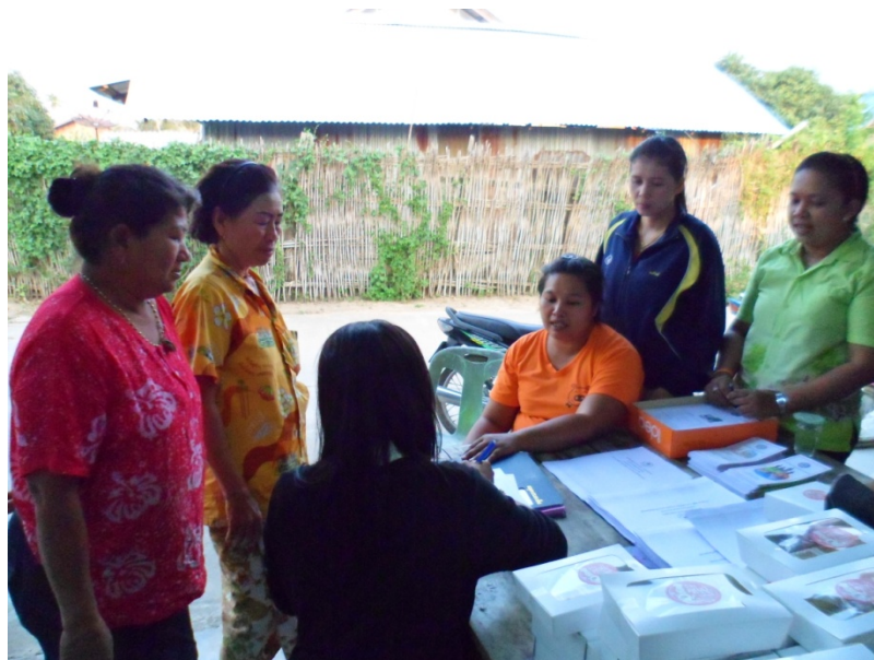
ประชุมทำแผนครั้งที่ ๑

๑. ประชุมชี้แจงการจัดทำแผนพัฒนาหมู่บ้านแก่ผู้นำประชาชน ,หัวหน้าคุ้ม และอธิบายแบบสำรวจข้อมูล