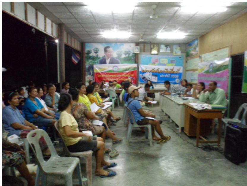
ประชุมทำแผนครั้งที่ ๓ ๓. ยกร่างแผนพัฒนาหมู่บ้าน