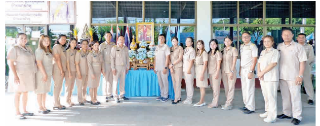
RAIKOKE SUBDISTRICT ADMINISTRATIVE ORGANIZATION PHETCHABURI